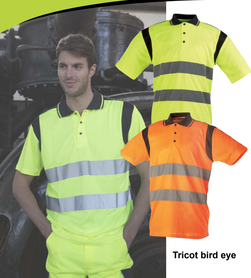
Tricot bird eye