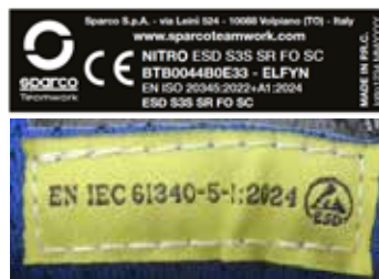
ÉTIQUETTE « CE » INTERNE à l'intérieur de la languette Dim. 50 x 15 mm + ESD LABEL