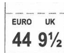
ÉTIQUETTE TAILLE cousue entre la tige et la languette Dim. 17 x 14 mm