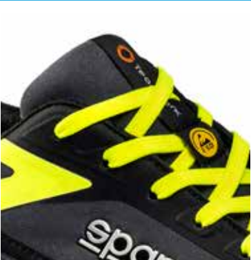
Étiquette en tissu jacquard TEAMWORK sur la languette. Marque ESD sur les crochets à lacets.