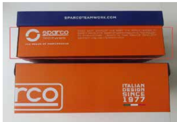
BOÎTE À CHAUSSURES SPARCO TEAMWORK en carton bleu-blanc-orange et papier de soie protecteur à l'intérieur. Dimensions 343x258x123 mm. Indications de recyclage valables pour l'ITALIE au dos (PAP20).