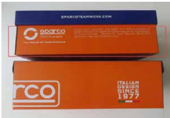
BOÎTE À CHAUSSURES SPARCO TEAMWORK en carton bleu-blanc-orange et papier de soie protecteur à l'intérieur. Dimensions 343x258x123 mm. Indications de recyclage valables pour l'ITALIE au dos (PAP20).