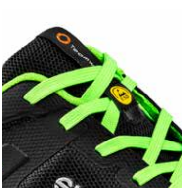
Étiquette en tissu jacquard TEAMWORK sur la languette. Marque ESD sur les crochets à lacets.