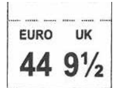
ÉTIQUETTE TAILLE cousue entre la tige et la languette Dim. 17 x 14 mm