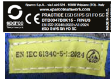
ÉTIQUETTE « CE » INTERNE à l'intérieur de la languette Dim. 50 x 15 mm + ESD LABEL