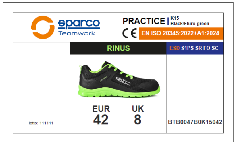
ÉTIQUETTE EXTÉRIÈRE DE LA BOÎTE Appliquée sur le côté de la boîte, elle indique les caractéristiques du produit, la certification, le numéro de lot, le code produit, le code QR et le code-barres. Dimensions : 105 x 60 mm.