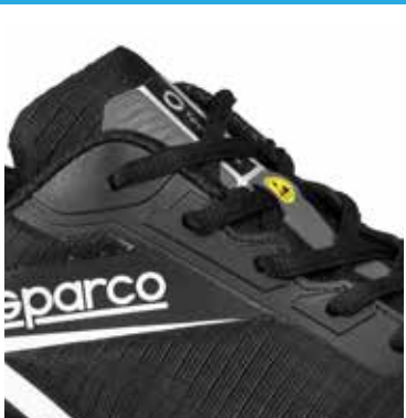
Logo TEAMWORK imprimé sur la languette (15 x 60 mm) Logo ESD sur les œillets.