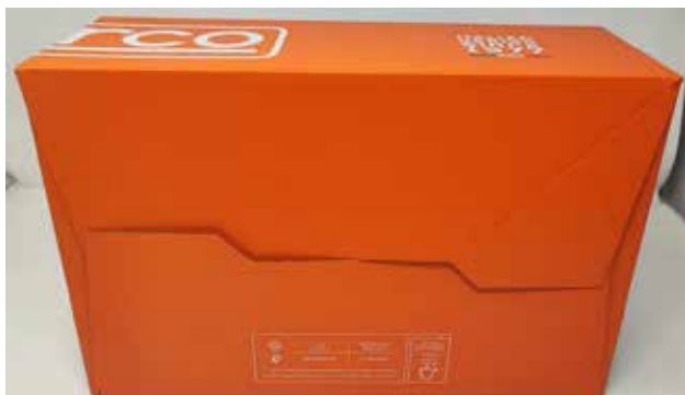
BOÎTE À CHAUSSURES SPARCO TEAMWORK en carton bleu-blanc-orange et papier de soie protecteur à l'intérieur. Dimensions 343x258x123 mm. Indications de recyclage valables pour l'ITALIE au dos (PAP20).