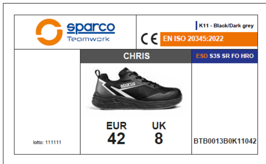
ÉTIQUETTE EXTÉRIÈRE DE LA BOÎTE Appliquée sur le côté prévu à cet effet de la boîte, elle indique les caractéristiques du produit, la certification, le numéro de lot, le code produit, le code QR et le code-barres. Dimensions : 105 x 60 mm.