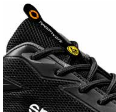
Étiquette TEAMWORK en tissu jacquard sur la languette, Logo ESD sur les œillets.