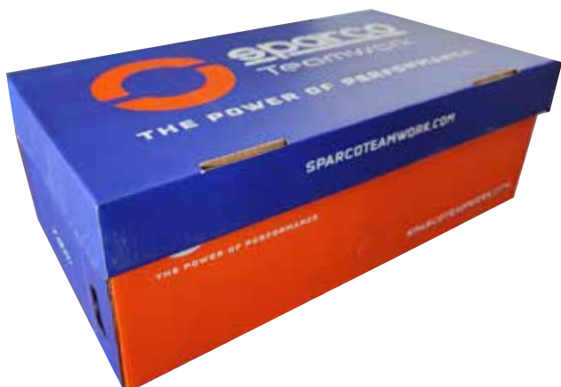
BOÎTE À CHAUSSURES SPARCO TEAMWORK en carton bleu-blanc-orange et papier de soie protecteur à l'intérieur. Dimensions 343x258x123 mm. Indications de recyclage valables pour l'ITALIE au dos (PAP20).