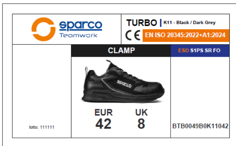
ÉTIQUETTE EXTÉRIÈRE DE LA BOÎTE Appliquée sur le côté de la boîte, elle indique les caractéristiques du produit, la certification, le numéro de lot, le code produit, le code QR et le code-barres. Dimensions : 105 x 60 mm.