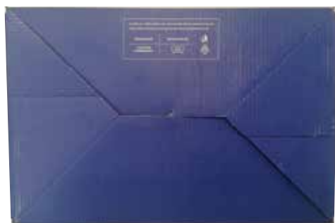
BOÎTE À CHAUSSURES SPARCO TEAMWORK en carton bleu-blanc-orange et papier de soie protecteur à l'intérieur. Dimensions 343x258x123 mm. Indications de recyclage valables pour l'ITALIE au dos (PAP20).