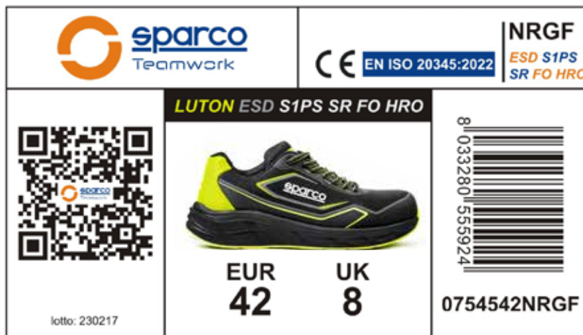
ÉTIQUETTE EXTÉRIÈRE DE LA BOÎTE Appliquée sur le côté prévu à cet effet de la boîte, elle indique les caractéristiques du produit, la certification, le numéro de lot, le code produit, le code QR et le code-barres. Dimensions : 105 x 60 mm.