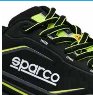
Logo TEAMWORK imprimé sur la languette (15 x 60 mm) Logo ESD sur les œillets.