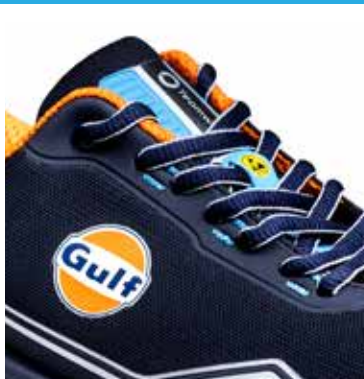
Logo TEAMWORK imprimé sur la languette (15 x 60 mm) Logo ESD sur les œillets.