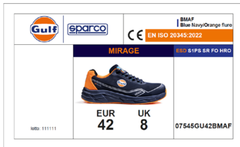
ÉTIQUETTE EXTÉRIEURE DE LA BOÎTE Appliquée sur le côté prévu à cet effet de la boîte, elle indique les caractéristiques du produit, la certification, le numéro de lot, le code produit, le code QR et le code-barres. Dimensions : 105 x 60 mm.