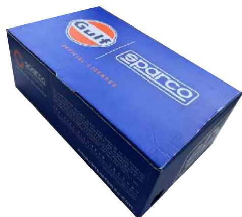
BOÎTE À CHAUSSURES SPARCO TEAMWORK GULF en carton bleu-blanc-orange et papier de soie protecteur à l'intérieur. Dimensions 343x258x123 mm Indications de recyclage valables pour l'ITALIE au dos (PAP20) + ÉTIQUETTE