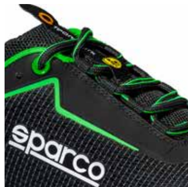
Logo TEAMWORK imprimé sur la languette (15 x 60 mm) Logo ESD sur les œillets.