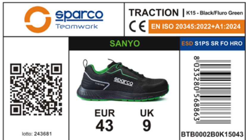
ÉTIQUETTE EXTÉRIEURE DE LA BOÎTE Appliquée sur le côté de la boîte, elle indique les caractéristiques du produit, la certification, le numéro de lot, le code produit, le code QR et le code-barres. Dimensions : 105 x 60 mm.