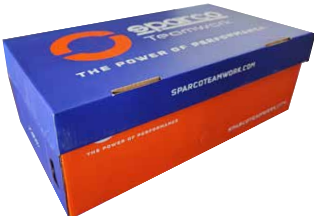
BOÎTE À CHAUSSURES SPARCO TEAMWORK en carton bleu-blanc-orange et papier de soie protecteur à l'intérieur. Dimensions 343x258x123 mm. Indications de recyclage valables pour l'ITALIE au dos (PAP20).