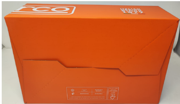
BOÎTE À CHAUSSURES SPARCO TEAMWORK en carton bleu-blanc-orange et papier de soie protecteur à l'intérieur. Dimensions 343x258x123 mm. Indications de recyclage valables pour l'ITALIE au dos (PAP20).