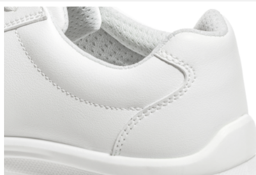
Rembourrage à la cheville.