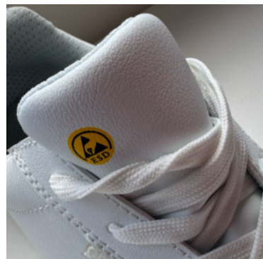
Marquage ESD imprimé sur la languette.