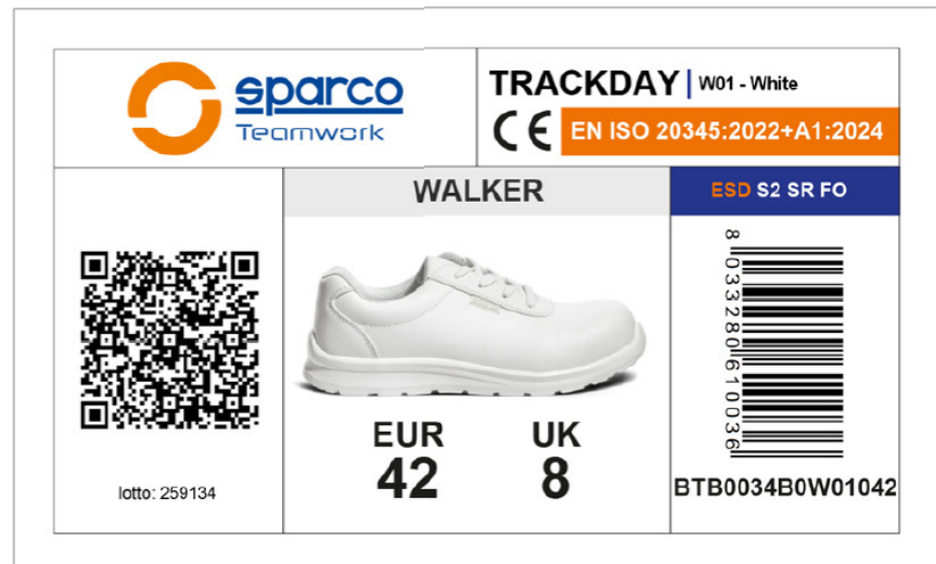
ÉTIQUETTE EXTÉRIÈRE DE LA BOÎTE Appliquée sur le côté de la boîte, elle indique les caractéristiques du produit, la certification, le numéro de lot, le code produit, le code QR et le code-barres. Dimensions : 105 x 60 mm.