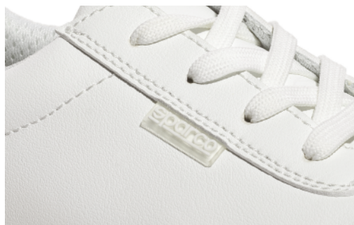
Étiquette Sparco en caoutchouc.