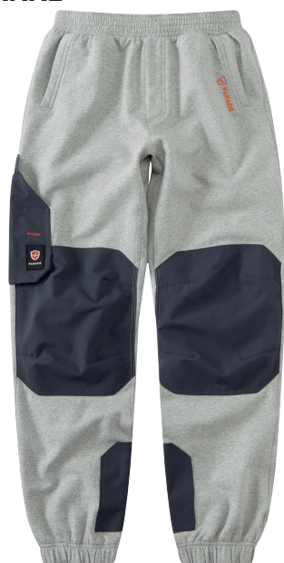
■ 1413 HEATHER GREY