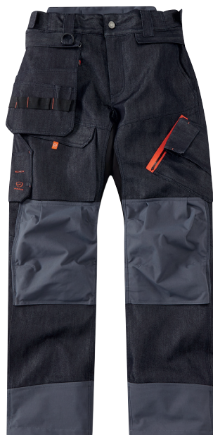
■ 1472 DENIM