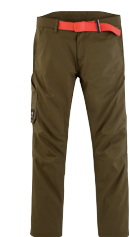
■ 1478 KHAKI