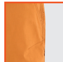
POCHE INVISIBLE CÔTÉ