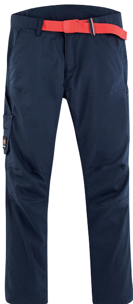
■ 1492 PARADE BLUE