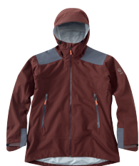
■ 1491 WINE