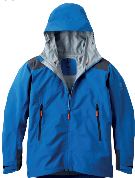
■ 1452 POP BLUE